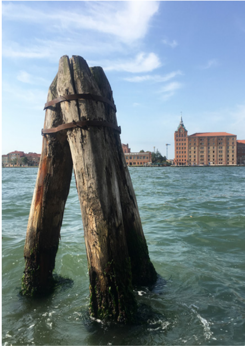
La bricola (in veneziano bricola) è una struttura nautica utilizzata per indicare le vie d'acqua nella laguna di Venezia.