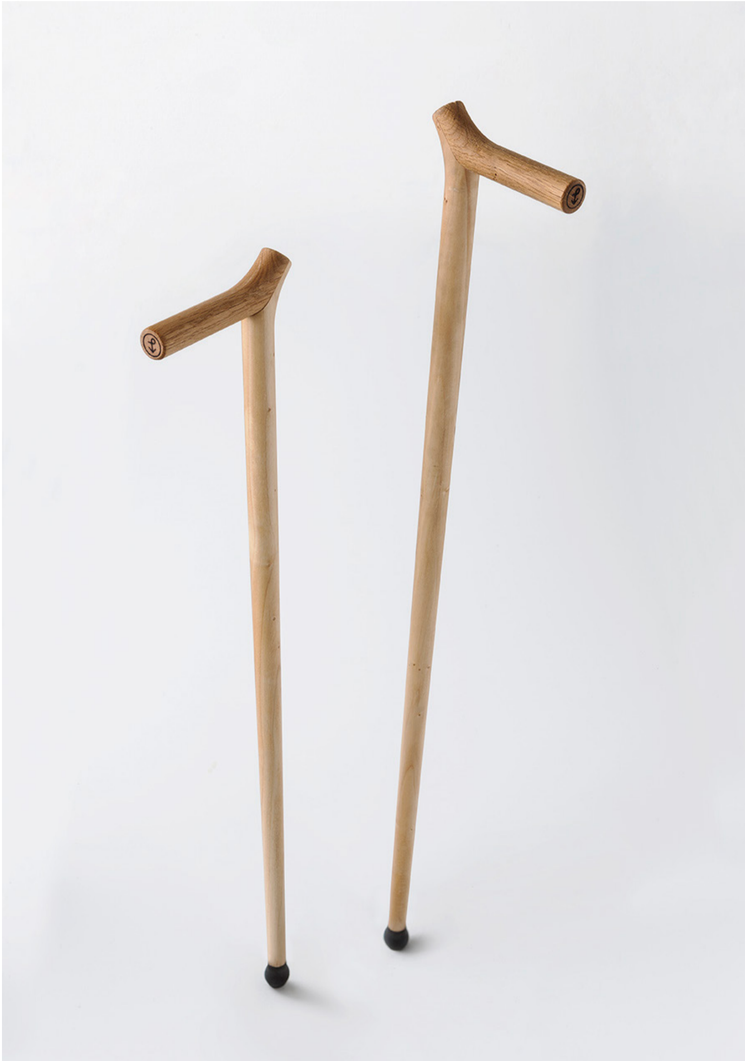
Bastone: Castello 3968 design Giulio Iachetti 2017

Fun fact: every object, like any creation of Pieces of Venice, is associated with a place in Venice so as to share a journey of discovery through unusual points of the city.