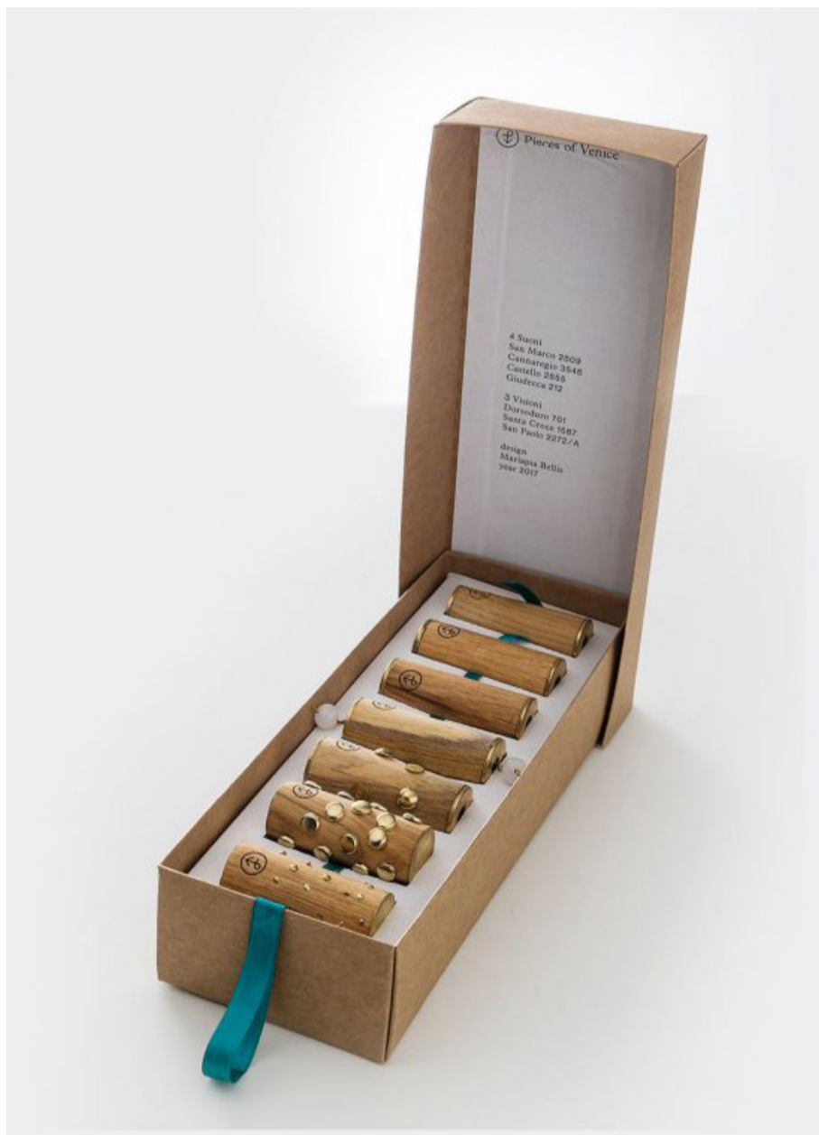
01 Sinistra: Portapillole: San Marco 4598 design Carlo Cumini 2017 Destra: Portapillole: San Polo 2012 design PoV Design Team 2017